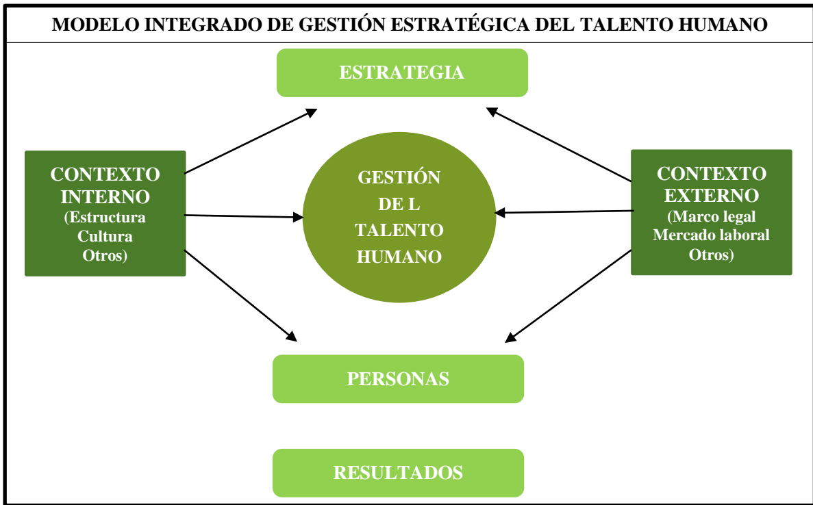
Figura No. 1. Modelo Integrado de Gestión Estratégica del Talento Humano adaptado de Serlavós, tomado de: (Longo, 2002 pág. 11)

Por consiguiente, dicho modelo consta de lo siguiente: