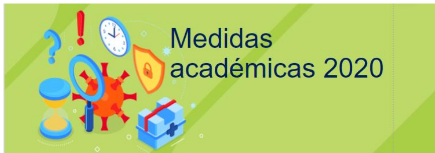
Ilustración 1. Percepción sobre medidas académicas por COVID-19 en 2020