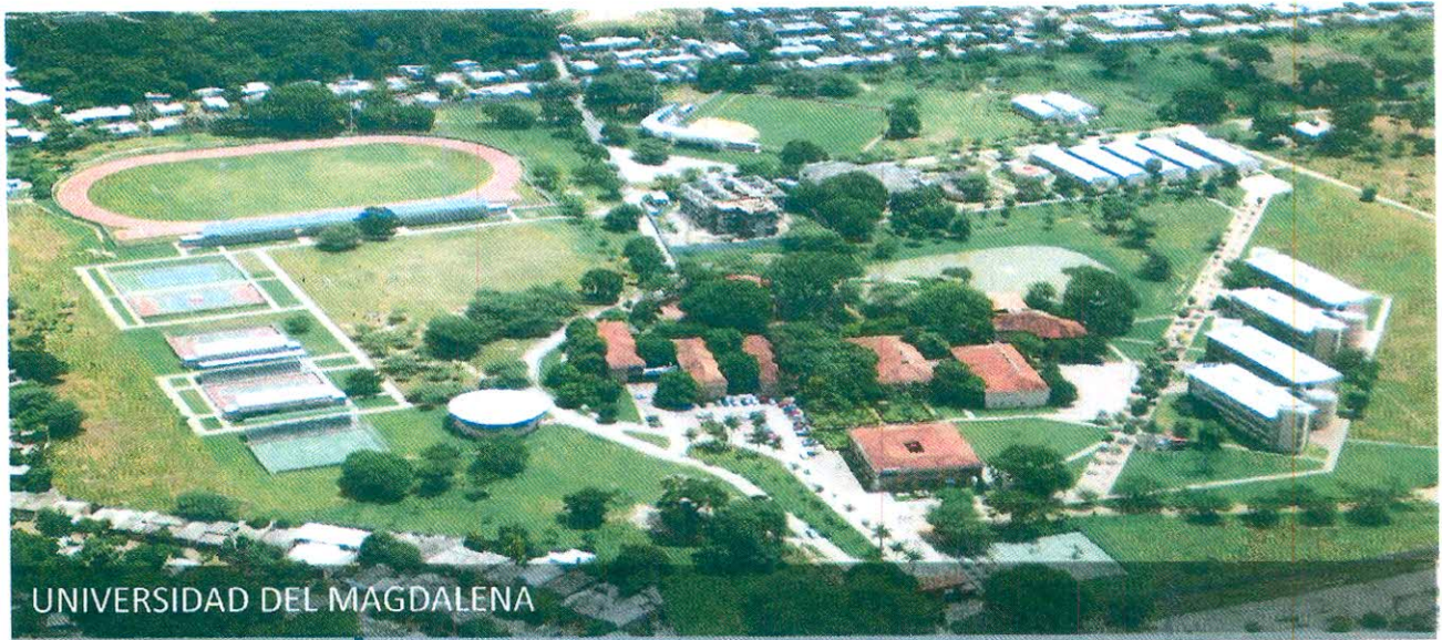
UNIVERSIDAD DEL MAGDALENA