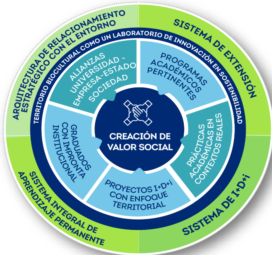
MODELO SISTÉMICO UNIVERSIDAD-ENTORNO. CÍRCULO VIRTUOSO RSU UNIMAGDALENA

La Universidad del Magdalena es una institución expandida que opera en red y materializa su compromiso con el desarrollo del territorio, a través del impacto positivo de sus graduados; una oferta académica pertinente, flexible y de alta calidad en diferentes niveles; la aplicación, difusión y transferencia de conocimiento científico, tecnológico, artístico y cultural y su apropiación en las comunidades para la creación de valor social. Lo anterior, en un relacionamiento sinérgico y constante con el entorno, mediante alianzas universidad-empresa-estado-sociedad, así como el diálogo e intercambio de saberes que estimulen la democratización y el acceso al conocimiento, valorando la diversidad y las potencialidades del territorio. (Plan de Desarrollo Unimagdalena, 2020-2030).