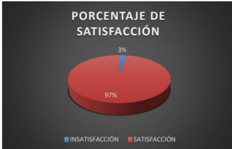
Ilustración 1. Gráfico porcentaje de satisfacción de usuarios

Se evidenció que el 97% de los usuarios encuestados ha quedado satisfecho con los servicios prestados.