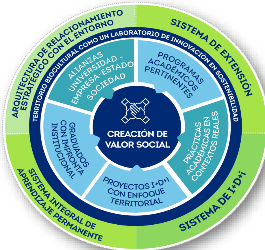
MODELO SISTÉMICO UNIVERSIDAD-ENTORNO. CÍRCULO VIRTUOSO RSU UNIMAGDALENA

La Universidad del Magdalena es una institución expandida que opera en red y materializa su compromiso con el desarrollo del territorio, a través del impacto positivo de sus graduados; una oferta académica pertinente, flexible y de alta calidad en diferentes niveles; la aplicación, difusión y transferencia de conocimiento científico, tecnológico, artístico y cultural y su apropiación en las comunidades para la creación de valor social. Lo anterior, en un relacionamiento sinérgico y constante con el entorno, mediante alianzas universidad-empresa-estado-sociedad, así como el diálogo e intercambio de saberes que estimulen la democratización y el acceso al conocimiento, valorando la diversidad y las potencialidades del territorio. (Plan de Desarrollo Unimagdalena, 2020-2030).